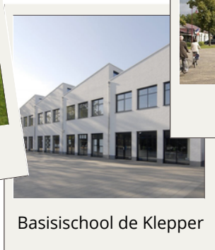
Basisschool de Klepper